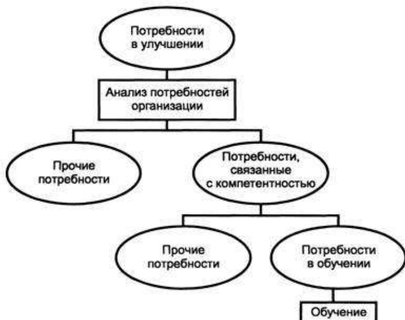
Рисунок 1 - Повышение качества посредством обучения